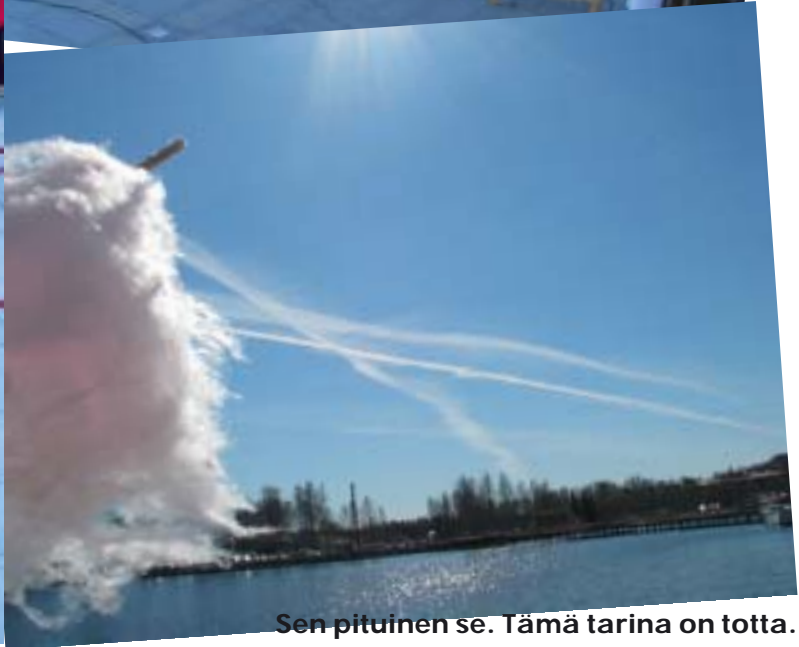
Sen pituinen se. Tämä tarina on totta.