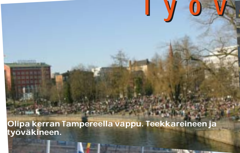
Olipa kerran Tampereella vappu. Teekkareineen ja työväkiin.