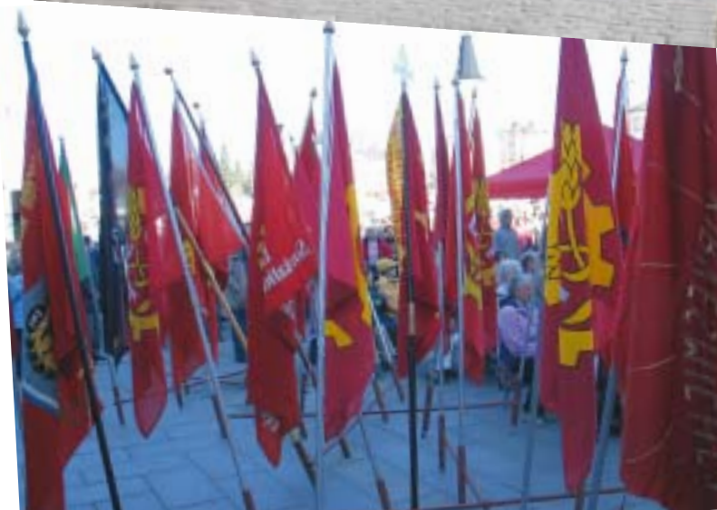
Myös puheita ja laulua kuunteli runsas joukko.