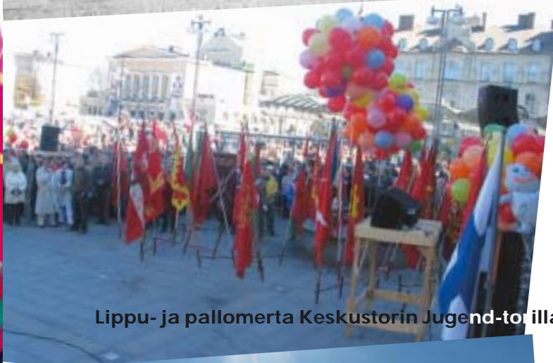
Lippu- ja pallomerta Keskustorin Jugend-torilla