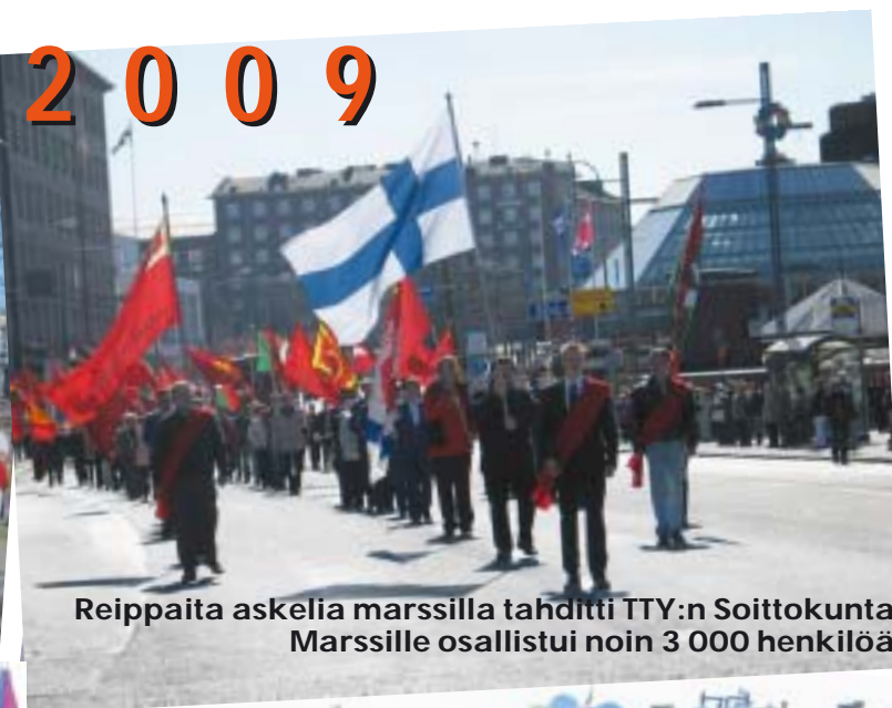
Reippaita askelia marssilla tahditti TTY:n Soittokunta. Marssille osallistui noin 3 000 henkilöä.