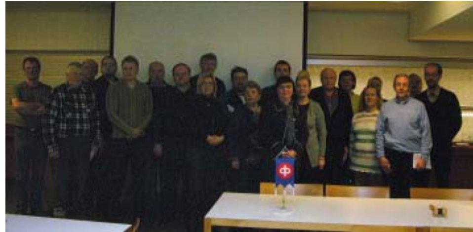
SAK:n Tampereen Paikallisjärjestön vastavalittu hallitus vuosille 2010 – 2011. (Kuvassa Edustajiston syyskokouksessa paikalla olleita)..

SAK:n Tampereen Paikallisjärjestön toiminnan tarkoituksena on sen jäsenkunnan henkisen ja aineellisen hyvinvoinnin, yhteiskunnallisen oikeudenmukaisuuden, järjestöllisen aseman ja toimintavalmiuksien edistäminen.